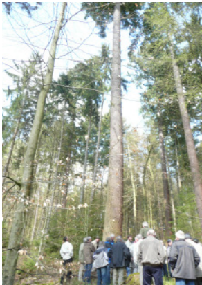
Ausflug 2011 in den Spessart

„Zusammen mit einer Reihe verlässlicher, heimischer Unternehmer können wir alle Arbeiten rund um den Wald anbieten.“